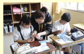
裁縫ボランティア